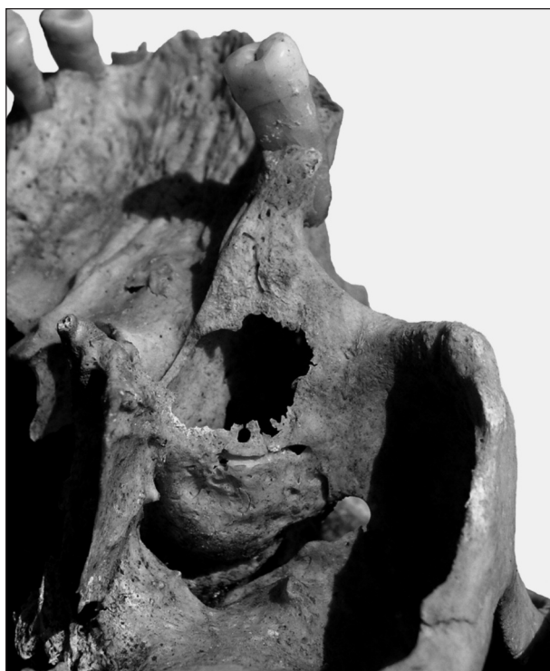
Obr. 1. Na levé horní čelisti asi 50–60letého muže (hrob č. A 810) byly nalezeny v oblasti kořenů třetí stoličky stopy po chronickém zánětlivém procesu, který perforoval sinus maxillaris.