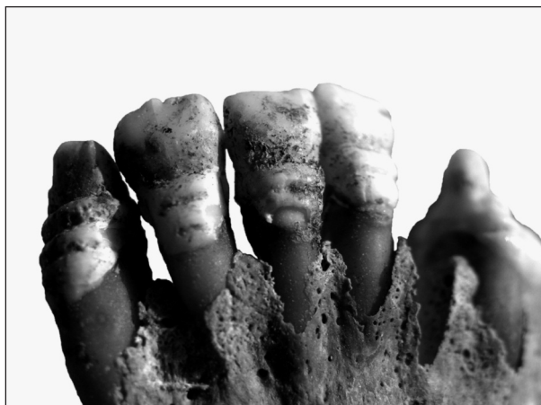
Obr. 2. Fragменты lebky gracilní 14–18leté dívky (hrob č. A 1843) s výraznou hypoplázií zubů.

tu. V jednom případě (hrob č. A 867) byl příčinou hypoplázie chrupu pravděpodobně nedostatek vitamínu C – kurděje, neboť byly na některých kostech tohoto postkranálního skeletu pozorovány stopy po zosifikovaných subperiostálních hematomech. U zbývajících pěti případů hypoplázie zubní skloviny bylo možno o její příčině pouze spekulovat (například hrob č. A 1843) (obr. 2).