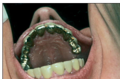
Obr. 6. Stav po odevzdání definitivní protetické práce - pohled v zrcadle. Fig. 6. The condition after the definitive prosthetic work was made - looking in the mirror.