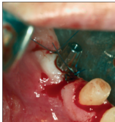
Obr. 9. Preparace pilířových zubů a zavedení implantátu, zatížení ihned. Fig. 9. Preparation of pillar teeth and introduction of implant - loaded immediately.