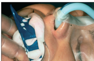
Obr. 4. Otisk horní čelisti na provizorní můstek, provedeno v celkové anestezii. Fig. 4. The impression of upper jaw on a temporary bridge, performed in general anesthesia.