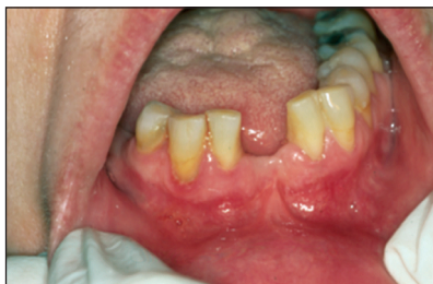
Obr. 1. Hygiena ústní dutiny před zahájením ošetření. Fig. 1. Oral cavity hygiene before starting the treatment.