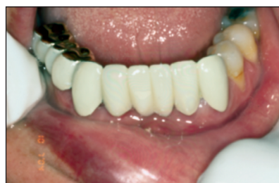
Obr. 12. Stav po odevzdání definitivní protetické práce. Fig. 12. The condition after the definitive prosthetic work was made.