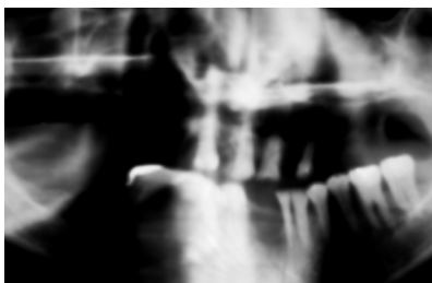
Obr. 2. RTG panoramatický snímek před zahájením ošetření. Fig. 2. Panoramic X-ray picture before starting the treatment.