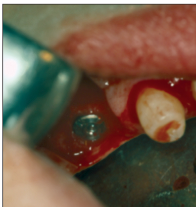
Obr. 3. Preparace pilířových zubů a zavedení implantátu v horní čelisti. Fig. 3. Preparation of pillar teeth and introduction of implant in upper jaw.