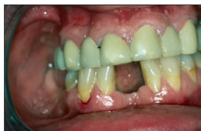
Obr. 7. Stav po odevzdání definitivní práce - pohled přímý. Fig. 7. The condition after the definitive prosthetic work was made - a direct view.