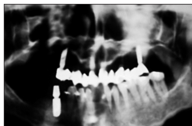
Obr. 10. RTG panoramatický snímek po vhojení implantátů. Fig. 10. Panoramic X-ray picture after the implant healed up.