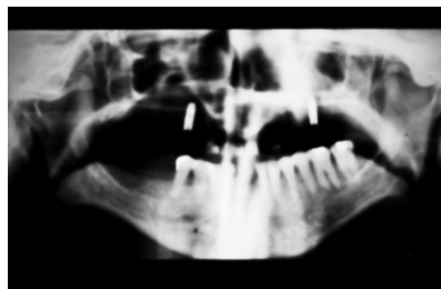
Obr. 5. RTG panoramatický snímek po vhojení implantátů. Fig. 5. Panoramic X-ray picture after the implant healed up.