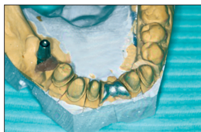
Obr. 11. Laboratorní model s laboratorním analogem. Fig. 11. Laboratory model with a laboratory analog.