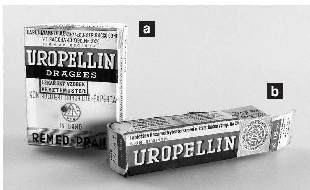
Obr. 7. Uropellin Dragées (a) (před 1939) a Uropellin Tablettae (b) (po 1939), kontrolované Expertou

10. Indikační označení muselo odpovídat ustáleným lékařským zásadám. Seznam chorob, proti kterým se mohl LP použít, musel být uveden způsobem pro laickou veřejnost nesrozumitelným .