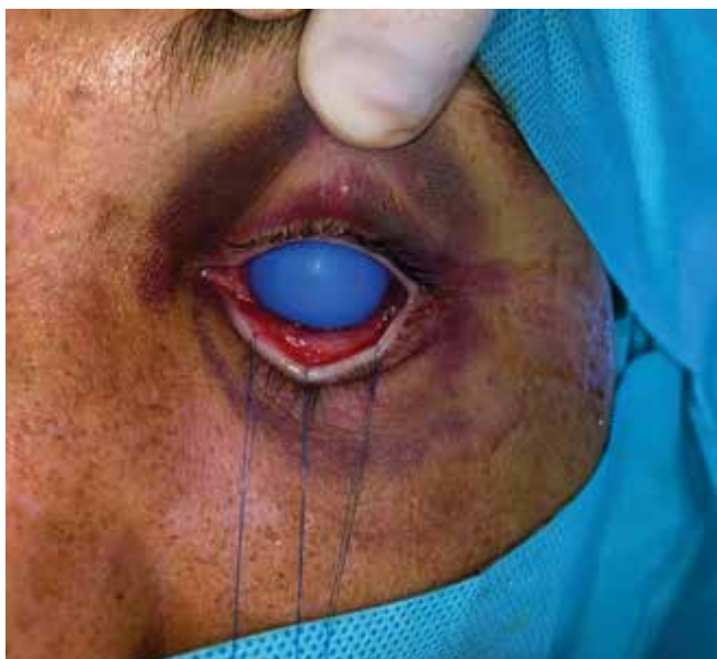
Obrázok 1. Fixačné stehy na dolnej mihalnici a gumový chránič rohovky

zoval tento prístup k vizualizácii spodiny očnice a maxily. Na našom pracovisku využívame transkonjunktiválny prístup ako primárny prístup k vizualizácii a otvorenej chirurgickej liečbe zlomenín dolného orbitálneho okraja a spodiny očnice pravidelne od vzniku pracoviska v roku 2017. Pri transkonjunktiválnom prístupe na infraorbitálne