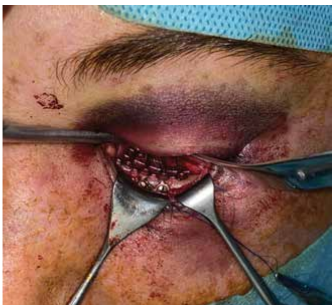
Obrázok 5. Rekonštrukcia zlomeniny spodiny očnice titánovou mriežkou

klinike aktuálne transkonjunktiválny prístup ponechávame prevažne bez sutúry spojovky a doteraz sme nepozorovali vyššiu incidenciu komplikácií spojených so spontánnym hojením bez chirurgického uzáveru incízie spojovky sutúrou. Z našej skúsenosti transkonjunktiválny prístup poskytuje dostatočnú možnosť vizualizácie infraorbitálneho marga a spodiny očnice a zabezpečuje dobrý prehľad v operačnom poli. Pri rutinnom používaní transkonjunktiválneho prístupu bolo možné skrátiť operačný čas potrebný od prvotnej incízie k vizualizácii dolného orbitálneho okraja. Transkonjunktiválny prístup využívame aj pri bilaterálnych zlomeninách strednej etáže tváre s nutnosťou chirurgickej vizualizácie dolného orbitálneho okraja alebo spodiny očnice unilaterálne, či bilaterálne. Pri chirurgickej liečbe izolovaných zlomenín spodiny očnice, ktorú sme v našom súbore zaznamenali