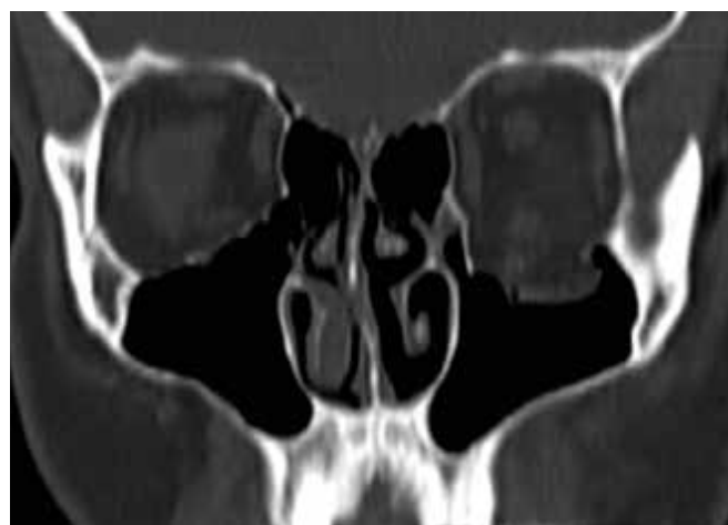
Obrázok 7. Predoperačné CT zobrazenie zlomeniny spodiny očnice vľavo – koronárny rez