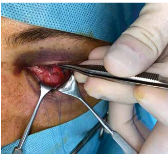
Obrázok 3. Vizualizácia orbitálneho septa preseptálnou preparáciou