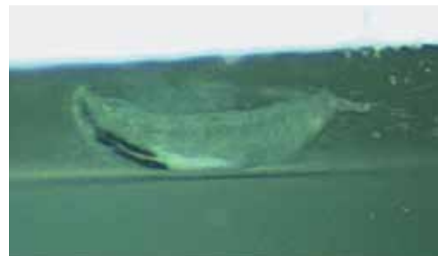
Obrázek 3. Uložený jedinec larvy Oestrus ovis ve Formolu focený na šterbinové lampě

Popisujeme případ očního onemocnění u muže středního věku z Čech, jenž trávil letní dovolenou sedm týdnů před vyšetřením na severu Řecka. V pozdních večerních hodinách v posledním srpnovém týdnu roku 2019 navštívil pacient oční pohotovostní službu. Údajně mu do levého oka vletly piliny, oko slzelo a bolelo. Kromě drobné eroze epitelu rohovky a lehce překrvené spojivky se zvláště ve vnitřním koutku a při podrobnějším vyšetření po celém povrchu bulbární spojivky i ve fornixech rychle pohybovalo v slzném filmu vlnivým pohybem přes dvacet podlouhlých 1,5–2 mm velikých světlých mikroorganismů s tmavým rostrálním koncem (oči a orgány)