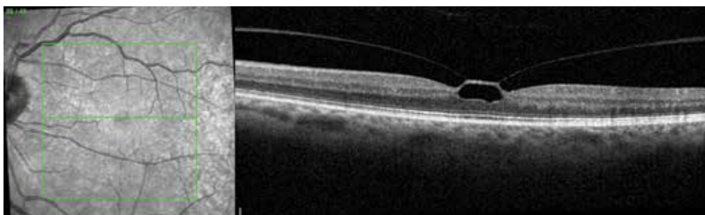
Obrázek 1. Vitreomakulární trakce před zákrokem

Vitreomakulární trakci se po jedné aplikaci C3F8 podaři- lo uvolnit u 13 očí (92,9 %), z toho u 11 očí (84,6 %) během prvního měsíce sledování, u dalších dvou očí do dvou mě- síců od zároku. U jednoho oka VMT přetrvává i po 9 měsí- cích sledování, je však menší a zraková ostrost se zlepšila. K uvolnění trakce došlo i u obou očí po předchozí neúspěš- né aplikaci ocriplasminu. U jednoho oka došlo s uvolněním trakce současně k rozvoji makulární díry, v tomto případě jsme indikovali PPV. Nejlépe korigovaná zraková ostrost se zlepšila ze vstupní průměrné hodnoty 0,50 (0,16–0,18) na 0,67 (0,2–1,0) ( p < 0,001 ). Ke zlepšení NKZO došlo u 11 očí (78,6 %), u tří očí zůstala stejná, ke zhoršení nedošlo u žád-