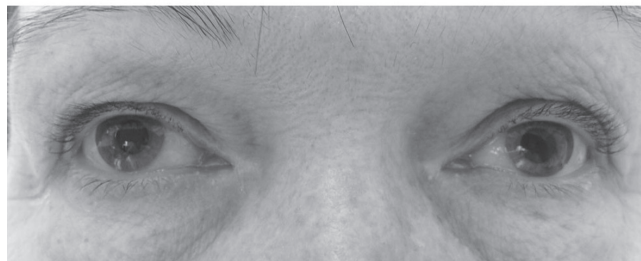
Obr. 1 Průměr zornice pravého oka byl před aplikací 1% fenylefrinu 5 mm, levého oka 3 mm (nahore). Hodinu po aplikaci 1% fenylefrinu se průměr zornice pravého oka nezměnil, na levém oku se zornice rozšířila a rovněž se zlepšil pokles horního víčka vlevo (dole). Výsledek testu ukázal na postganglionární lézi sympatiku vlevo

roztok fenylefrinu, který jsem si nechala připravit v lékárně nařazením 10% fenylefrinu (Neosynephrine-POS). Změřila jsem průměr zornice pravého a levého oka za stejných světelných podmínek před aplikací a jednu hodinu po aplikaci jedné kapky 1% roztoku fenylefrinu do spojivkového vaku obou očí. Před aplikací byl průměr zornice pravého oka 5 mm, levého oka 3 mm. Hodinu po aplikaci 1% fenylefrinu byl průměr zornice pravého oka 5 mm, levého 5 mm a rovněž se zlepšil pokles horního víčka vlevo (obr. 1). Výsledek testu ukázal na postganglionární lézi sympatiku vlevo.