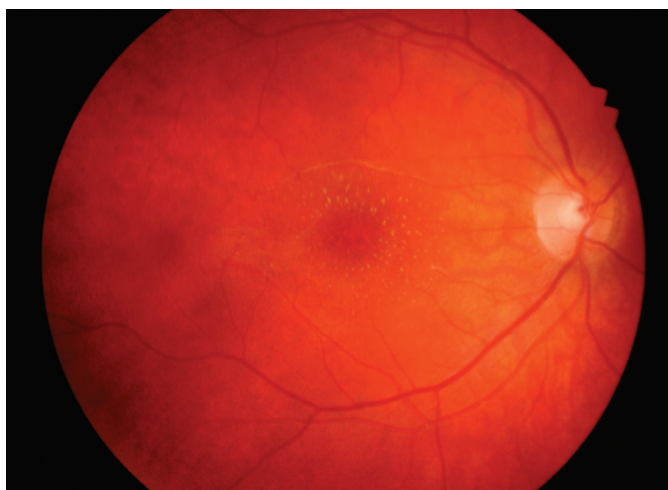
Obr. 3. Hvězdicová makulopatie pravého oka měsíc po léčbě