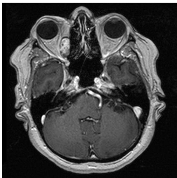
Obr. 5. MR, axiální řez, ostře ohraničená oválná expanze extraconálně lokalizovaná, v mediální části orbity sahající od báze po strop orbity. Jsou přítomny tlakové změny na vnitřním přímém svalu s otokem, tumor se postkontrastně sytí