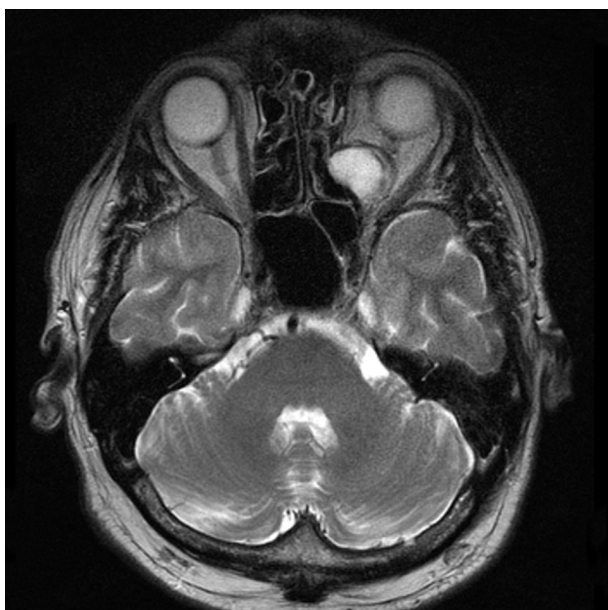
Obr. 4. MR, axiální řez, 1. pooperační den – reziduum tumoru, který je proti předoperačnímu nálezu zmenšen a vyklenut směrem do čichových sklípků