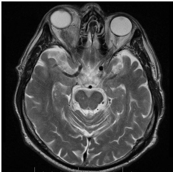
Obr. 2. MR, axiální řez – objemný tumorózní, zčásti cystický útvar v pravé očnici, který je lokalizován v zadním segmentu očním, mediálně extra- i intrakonálně, velikosti 25x28x35 mm, dosahující ke stropu orbity a deviuující optický nerv laterálně

Histologicky byla prokázána metastáza adenokarcinomu. Další vyšetření