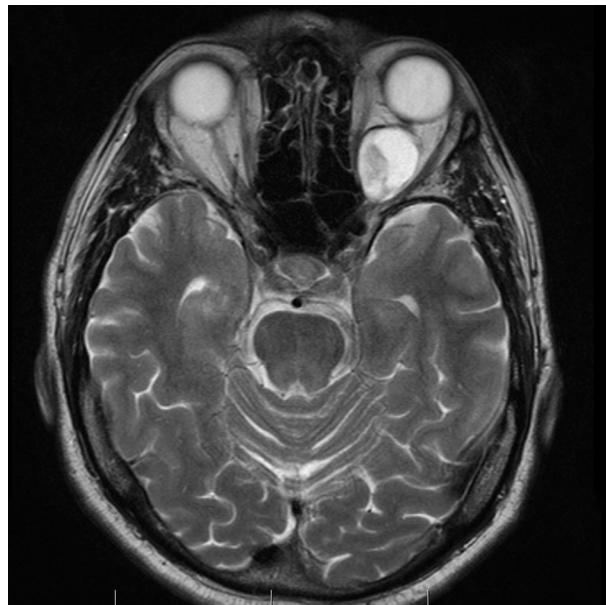
Obr. 3. MR, axiální řez – intrakonální, ostře ohraničený tumor převážně cystického charakteru s menší solidní porcí mediálně, velikosti 27x20x18mm, vyplňující vnitřní polovinu levé orbity retrobulbárně s elevací a laterální dislokací optického nervu a roztlačující okoohybné svaly do stran