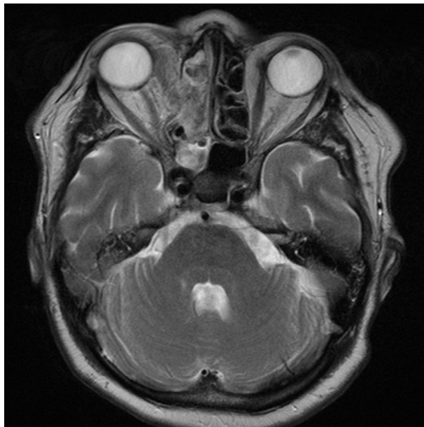
Obr. 6. MR, axiální řez, 1. pooperační den – tumor je kompletně odstraněn

prokázala nádorové postižení ledviny, metastatické postižení jater, plic, skeletu. Jako primární ložisko zvažováno tlusté střevo či ledvina. Pacient je t.č. v onkologické péči.