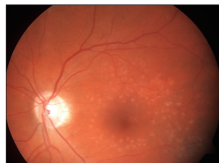
Obr. 4. Stav 1/2 roku po provedené fotokoagulaci – týž pacient jako na obr. 1

Studie prokázala lepší efekt ošetření DME laserem nežli intravitreální aplikací triamcinolonu při jeho menších vedlejších účincích. V extenzi studie DRCR.net bylo cílem porovnat účinnost fotokoagulace sítnice proti kombinované léčbě laserem s intravitreální aplikací triamcinolonu. V druhých dvou ramenech byla porovnávána účinnost intravitreální aplikace ranibizumabu (Lucentis, Genentech Inc., Novartis Pharma AG) v kombinaci s časnou a odloženou fotokoagulací sítnice laserem.