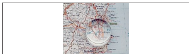
Obr. 7. Príložná lupa

Na základe analýzy získaných výsledkov sme zistovali a posudzovali efektívnosť predpisovania optických pomôcok na kompenzáciu ZP u detí.