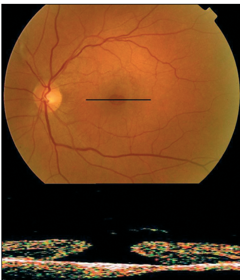
Obr. 1. předoperační nález na fundu pacienta se 3. stadiem IMD společně s korespondujícím OCT nálezem

Na obrázku 1 je patrný předoperační nález na fundu pacienta se 3. stadiem IMD společně s korespondujícím OCT nálezem. Na obrázku 2 je patrný pooperační nález na fundu téhož pacienta společně s OCT nálezem. Z obrázku je dobře patrné, že IMD se kompletně uzavřela.