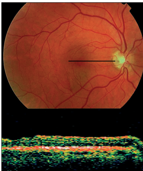
Obr. 3. Pooperační nález spolu s korespondujícím OCT nálezem

(polohování hlavy obličejem dolů) po dobu 2 týdnů.