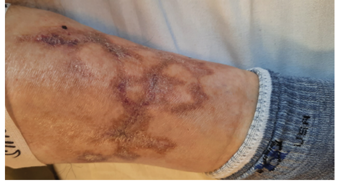
Obr. 5. Iniciální kalcifylaxe

Pacient 4 – Pacient byl sledován v predialyzační nefrologické ambulanci pro pokročilou chronické onemocnění ledvin, dosud bez nutnosti zahájení dialyzační léčby a bez známek uremie. Pro vysokou koncentraci PTH mu byl předepsán parikalcitol. Po několika týdnech této terapie se dostavil s náhle vzniklými, výraznými a spontánními bolestmi lýtky, doprovázenými změnami barvy kůže. Klinický obraz byl vyhodnocen jako iniciální kalcifylaxe v kontextu již pokročilé renální insuficience s hyperfosfatemii a současně terapií aktivním vitaminem D. Souběžně pacient užíval warfarin. Léčba parikalcitolem i warfarinem byla ihned ukončena. Přetrvávající hyperfosfatemie vedla k zahájení dialyzačního programu s cílem dosáhnout normofosfatemie. Do terapie byl vřazen thiosulfát. Kožní nález se následně zcela zhojil. Později byl pacient úspěšně transplantován. Publikováno (10).