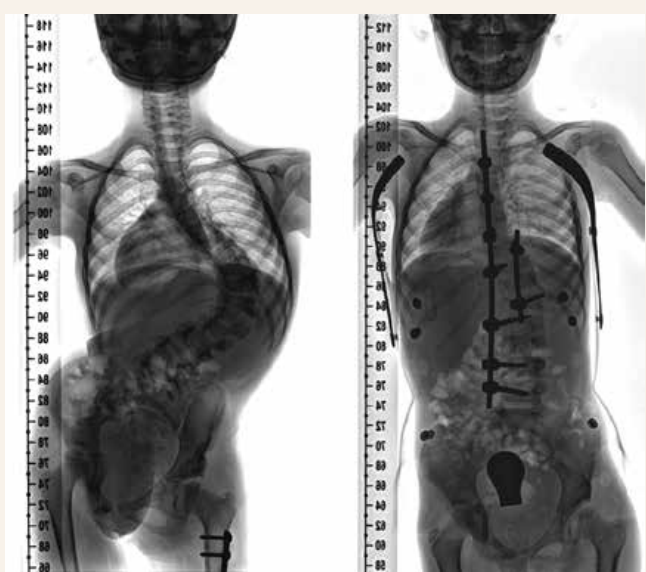
Obr. 6 | RTG-snímky 8 mesiacov od operačného výkonu na chrbtici.