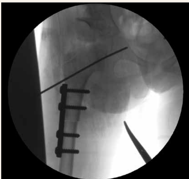
Obr. 4 | Zalomenie Kirschnerovho drôtu intraartikulárne.