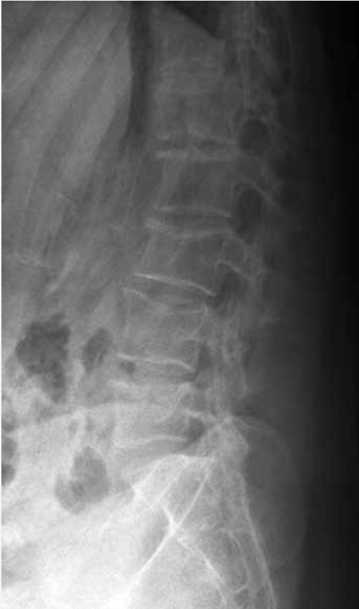
Obr. 1 | RTG LS páteře pacientky s prořídou strukturou obratlových těl

těl a disků. Pacientka byla odeslána k došetření do osteologické poradny. Denzitometrický nález odpovídal v bederní oblasti osteoporóze s hodnotou Z-skóre -4,0 a s normálním nálezem na skeletu distálního předloktí (Z-skóre 0,3), obr. 2 . Měření oblasti proximálního femuru nebylo provedeno pro výrazné bolesti pacientky při pokusu o polohování dolních končetin během měření.