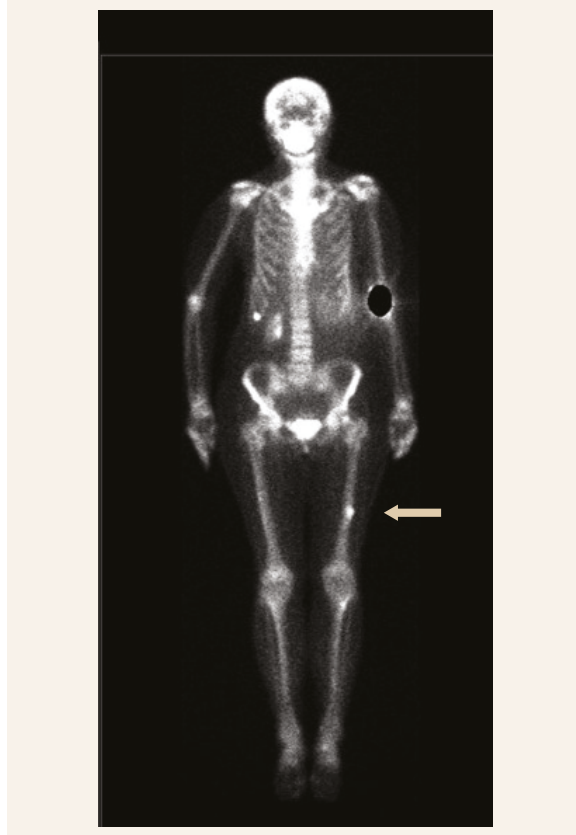
Obr. 3 | Kostní scintigrafie ^{99m}\text{Tc} značeným oxidronátem disodným (11. 1. 2019, vstupní): „osteoblastické ložisko“ v diafýze levého femoru

Pacientka pokračovala v suplementaci vápníkem do celkového denního příjmu 1 200 mg a cholekalciferolem 1 440 IU denně. Byl doplněn vitamin \text{K}_2 ve formě MK-7