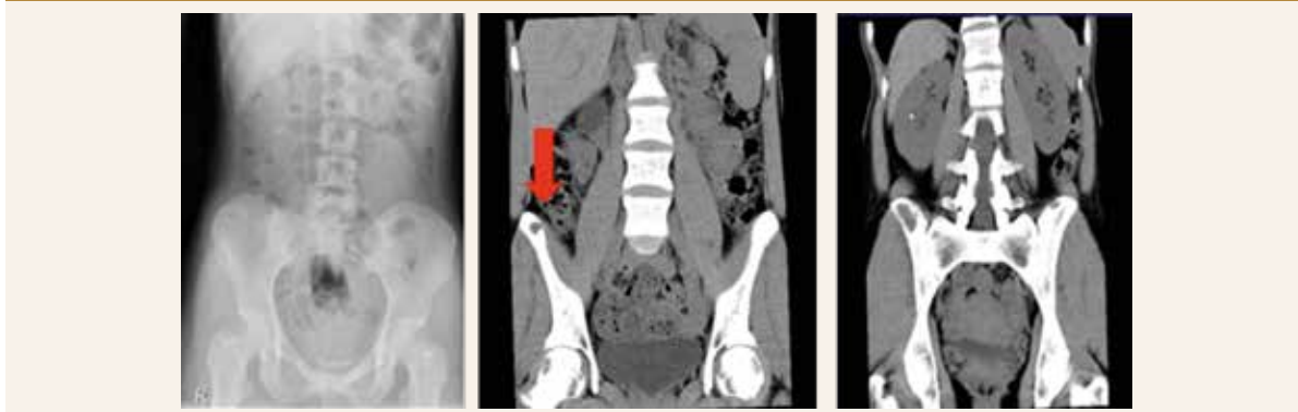
Obr. 1 | Mnohočetná osteolytická ložiska pánve