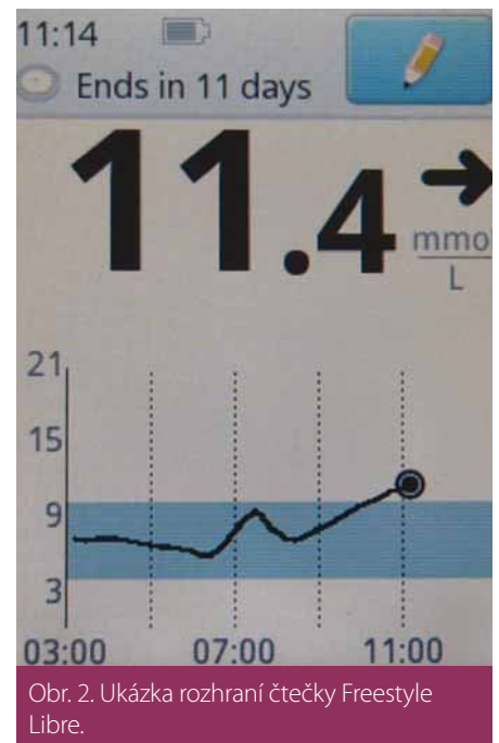
Obr. 2. Ukázka rozhraní čtečky Freestyle Libre.

Intervenovaná skupina prakticky nepoužívala glukometr, počet skenů byl zhruba 8x denně, tedy o něco méně než u diabetiků 1. typu v předešlých studiích. Kontrolní skupina měla v průměru 3,8 měření glukometrem denně. Během 6 měsíců studie nedošlo k významné změně glykovaného hemoglobinu celkově, ve skupině mladších pacientů pod 65 let věku vedla léčba FGM k malému statisticky významnému zlepšení kompenzace (proti kontrolní skupině < 3,5 mmol/mol). Změnil se čas strávený v hypoglykemii (o 0,47 hod/den v glykemii < 3,9 mmol/l) při léčbě FGM. Dalším rozdílem bylo zlepšení kvality života měřené dotazníkem DTSQ v intervenční skupině.