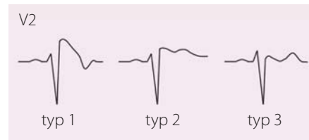
Obr. 1. EKG projevy Brugada syndromu, jediný „diagnostický“ je typ 1, tj. ST elevace ≥ 2 mm následovaná negativní vlnou bez izoelektrické nebo s minimální izoelektrickou linií, zvaný také „Coved type“; další dva typy nazýváme „Saddle back“ – typ 2 má mít výše J bod než T vlnu, typ 3 naopak. Upraveno dle [21,22].

nost NSS je u těchto jedinců o něco menší než u jedinců s korigovaným prodlouženým QT intervalem (4 vs. 15 %) [17]. Diagnostická kritéria pro LQTS jsou založena na rodinné anamnéze a EKG nálezu (tab. 4) [18]. Základními specifickými opatřeními jsou: u LQTS1 zákaz namáhavější/kompetitivní sportovní aktivity (obzvláště plavání a vodní sporty), vyvarovat se náhlým hlasitým zvukům (zvonění budíku) u LQTS2 a všem lékům prodlužujícím QT interval, což platí univerzálně pro všechny LQTS. Z léků jsou velmi efektivní betablokátoři v případě LQTS1, méně již u LQTS2 a LQTS3 [19]. U vysoce rizikových pacientů je s výhodou levostranná denervace srdečního sympatiku (left cardiac sympathetic denervation – LCSD); největší studie (n = 147 pacientů) u extrémně rizikových pacientů (QTc 543±65 ms) prokázala 91% redukci srdečních příhod [20]. Doporučené postupy HRS/EHRA/APHSR z roku 2013 nedoporučují implantaci ICD u asymptomatických pacientů s LQTS, u kterých nebyl vyzkoušen betablokátor krom zvláštních případů: