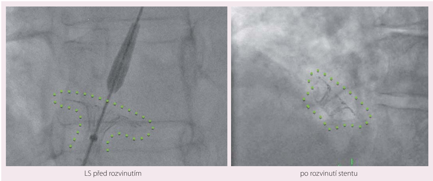
LS před rozvinutím

Dalším kritériem pro zařazení byl průkaz poruchy diastolické funkce levé komory pomocí echokardiografie pomocí pulzní dopplerovské a tkáňové echokardiografie a průkaz zvětšení levé síně. Pacienti s anamnézou cévní mozkové příhody, hluboké žilní trombózy, plicní