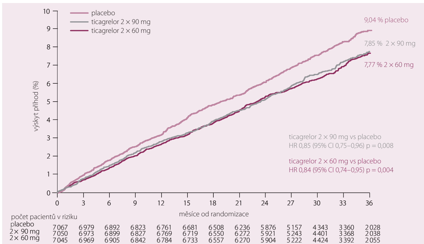
Graf 1. PEGASUS-TIMI 54 – primární cíl.