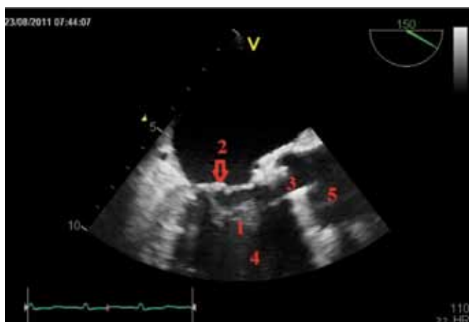
Obr. 3. Transesophageální echokardiografie. Echogenní útvar vycházející z mitrální chlopně vylající do LVOT. 1 – akcesorní závěsný aparát mitrální chlopně, 2 – mitrální chlopně, 3 – otevřená umělá aortální chlopně, 4 – levá komora, 5 – aorta

V případě náhle vzniklé aortální regurgitace manifestující se akutním srdečním selháním u pacienta po mechanické chlopní náhradě je třeba myslet v první řadě na mechanickou dysfunkci chlopní náhrady způsobenou nejčastěji infekční endokarditidou či trombotickou okluzí, zvláště při neúčinné antikoagulační terapii. Jako další příčina přichází v úvahu přerůstající panus či méně často srdeční nádor. Velice vzácnou příčinou může být i akcesorní závěsný aparát mitrální chlopně, jako tomu bylo i v případě našeho pacienta. Toto raritní kongenitální onemocnění se často manifestuje symptomy způsobenými obstrukcí výtokového traktu [1], výjimečně pak těžkou aortální regurgitací [2]. Ve většině případů se symptomy objeví již v první dekádě života