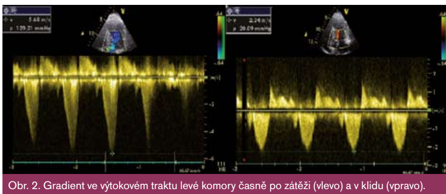
Obr. 2. Gradient ve výtokovém traktu levé komory časně po zátěži (vlevo) a v klidu (vpravo).

k redukcí dávky betablokátoru na 25 mg metoprololu 2krát denně, při které došlo k vymizení zrakových symptomů a normalizaci hodnot TK. Kontrolní echokardiografické vyšetření prokázalo normální hodnoty tlakového gradientu v LVOT v klidu a vzestup gradientu po Valsalvově manévru na 36 mmHg. Pacient nadále odmítal provedení alkoholové septální ablace, a tak byl k stávající terapii přidán trimetazidin 35 mg 2krát denně. Při kontrole po dalších dvou měsících je pacient bez bolestí na hrudi, pozoruje pouze dušnost při větší námaze.