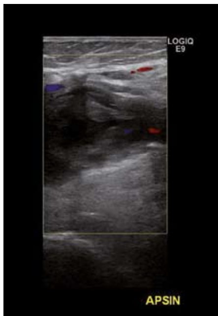
Obr. 3. Aneuryzma arteria poplitea – USG obraz. Akutně okludované aneuryzma trombotickým materiálem u pacienta s těžkým stupněm akutní končetinové ischemie.