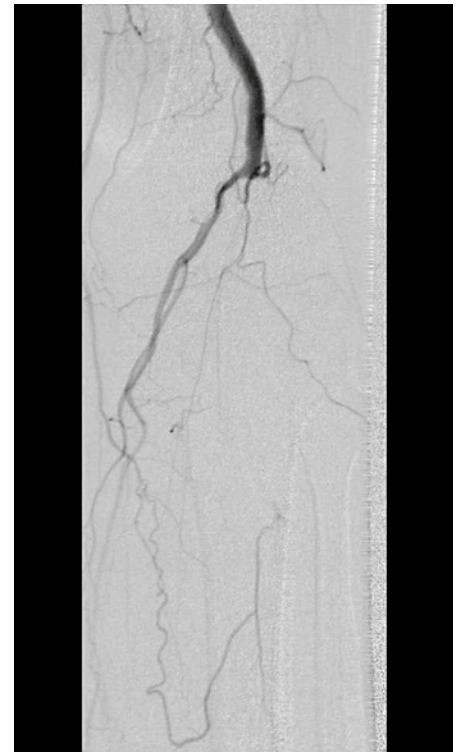
Obr. 2. Entrapment syndrom – angiografické vyšetření. Art. poplitea l. sin. je úplně uzavřená ve středním úseku, na bérce se plní pouze trosky bérceových tepen. 58letý pacient s absencí rizikových faktorů aterosklerózy s chronickou kritickou končetinovou ischemií.

Na aneurysma AP pomýšlíme při přítomnosti tepenných výdutí v jiných lokalizacích. Při fyzikálním vyšetření nalzáme nadměrnou pulzaci v podkolenní jámě, při symptomatické výdutí s distálními embolizacemi nejsou při-