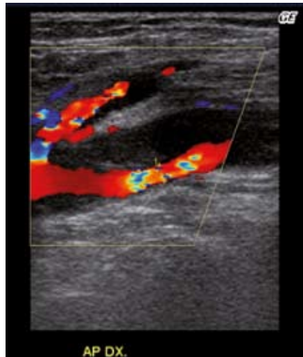
Obr. 6. Cystická degenerace adventicie. Sonografický obraz cysty v adventicii art. poplitea.

AP je častou lokalitou jak aterosklerotického, tak embolického postižení tepen dolních končetin. Ve srovnání s jinými periferními tepnami se zde však často vyskytují i onemocnění jiná, na která je nutno pamatovat při diferenciální diagnostice bolestí dolních končetin a jako na možné vyvolávající příčiny akutní a chronické