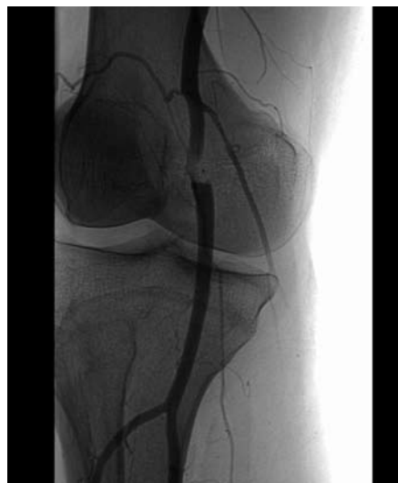
Obr. 7. Cystická degenerace adventicie. Stenóza art. poplitea podmíněná adventiciální cystou, obraz „hodinového skříčka“.

končetinové ischemie. Ve velké většině případů je postižení symetrické, proto mají být vyšetřovány vždy obě končetiny. Léčba těchto onemocnění (vyjma aterosklerózy a embolie) je optimálně preventivní, před vznikem ireverzibilních změn popliteální tepny a bérceových tepen.