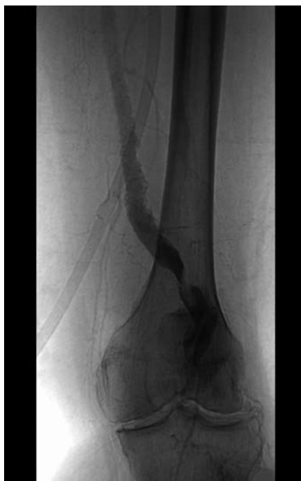
Obr. 4. Aneuryzma arteria poplitea – AG vyšetření. Okludované aneuryzma art. poplitea.