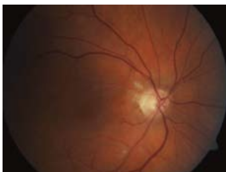
Obr. 4. Oční pozadí – týž pacient. Za jeden měsíc od podání systémové trombolytické terapie, vstřebání vatovitých exsudátů, téměř úplná úprava zrakové ostrosti.

ment Group for Lysis in The Eye Study). Jde zatím o jedinou prospektivní randomizovanou multicentrickou studii. Studie byla pečlivě připravena tak, aby přinesla jednoznačné výsledky a co nejvíce odpovídala reálné praxi. Nepřinesla však zdaleka takové výsledky, jaké odborná veřejnost očekávala. Původně měla probíhat v 16 centrech ve Švýcarsku, Německu a Rakousku, kde jsou s fibrinolytickou léčbou největší zkušenosti. Nábor začal v září roku 2002 a ukončení bylo v plánu v roce 2006. Autoři chtěli do každé z větví randomizovat po 200 pacientech, nicméně v dubnu roku 2005 bylo randomizováno jen 47 nemocných. Okno pro podání trombolytika bylo 20 hod a zraková ostrost před zahájením konzervativní nebo endovaskulární léčby musela být < 0,5 . Používaným fibrinolytikem byla altepláza. Primárním cílem bylo zhodnocení vizu až po jednom měsíci, protože z klinického pozorování je známo, že první efekt trombolytické léčby je sice patrný již po prvních 12 hod, kdy se obnovuje perfuze postiženou tepnou, nicméně ke zlepšování vizu dochází ještě v průběhu prvního měsíce, kdy regreduje edém papily zračkového nervu [12]. Druhotným cílem bylo porovnání bezpečnosti obou metod.