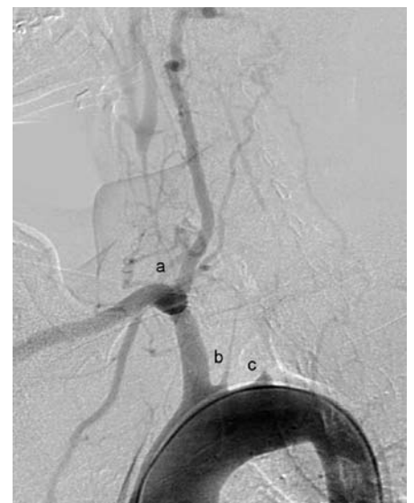
Obr. 3. Angiografický obrázek Takayasu arteritidy v chronickém stadiu s obliteracemi magistralních mozkových tepen. Mozek je zásobován jedinou mohutnou vertebrální tepnou. a – obliterace pravé společné karotidy, b – obliterace levé společné karotidy, c – obliterace levostranné podklíčkové tepny.

Léčba chronické periaortitidy a retroperitoneální fibrózy závisí na stupni renální insuficience. V případech pokročilého renálního selhání je indikováno včasné odstranění obstrukce močovýchodů a to buď retrográdní katetrizací ureterů, nebo perkutánní nefrostomií. Následuje operační řešení spočívající v uvolnění močovýchodů z okolního vaziva. Postoperačně je doporučována léčba kortikoidy k zabránění progresu onemocnění. V případě absence významnější renální insuficience doporučuje řada autorů primárně postupovat konzervativně a nemocné léčit kortikoidy. Ty vedou k ústupu systémových příznaků i ústupu uretrální obstrukce [23].