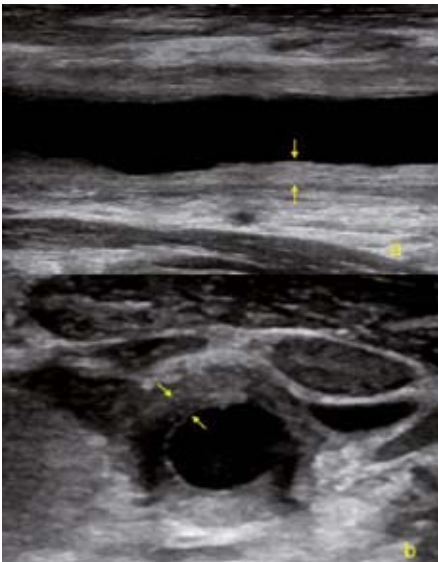
Obr. 1. USG obrázek difúzního zesílení cévní stěny společné karotidy v akutní fázi Takayasu arteritidy. a – podélná projekce, b – příčná projekce.