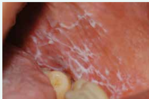
Obr. 2. Grinspanův syndrom – současný výskyt orálního lichen planus, DM a arteriální hypertenze. Retikulární léze na buňkách sliznicích u starší pacientky s DM2T a léčenou hypertenzí.

Závažným stavem při léčbě diabetu je kromě hyperglykemie také hypoglykemie. Japonští autoři sledovali vliv iatrogeně navozené hypoglykemie na parodontální tkáně: významný vliv prokázali zejména na buňky parodontálních ligament [20]. Pokud je kultivovali v prostředí s nadbytkem glukózy, byla narušena jejich schop-