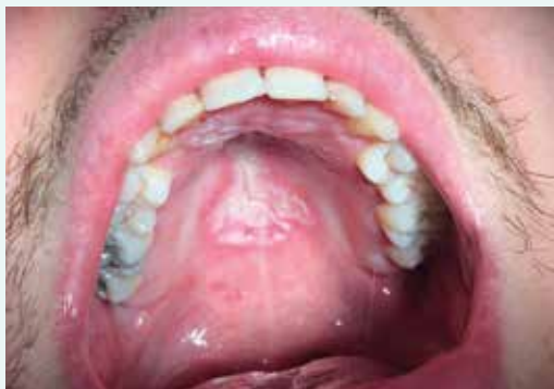
Obr. 1. Akutní pseudomembranózní kandidóza na patrové sliznici u nedostatečně kompenzovaného mladého diabetika 1. typu (22 let).

Intenzivní výzkum sledující výskyt gingivitidy (zánět dásní) a parodontitidy (zánět závěsného aparátu zubu) u diabetiků probíhá zejména od 60. let 20. století. Zaměřuje se především na DM2T, protože diabetici 1. typu bývají diagnostikováni a vyšetřováni hlavně v dětství (zejména ve skupině 11–15 let), kdy se parodontitida ještě nemusí projevit. V tomto věku je popisována vyšší prevalence gingivitid, a to až 2krát častější než u zdravých dětí a adolescentů a jejich těžší forma [13]. Juvenilní diabetik zřejmě reaguje zánětem dásní již na takové množství mikrobiálního zubního povlaku, které by u celkově zdravého jedince gingivitidu ještě nevyvolalo [14].