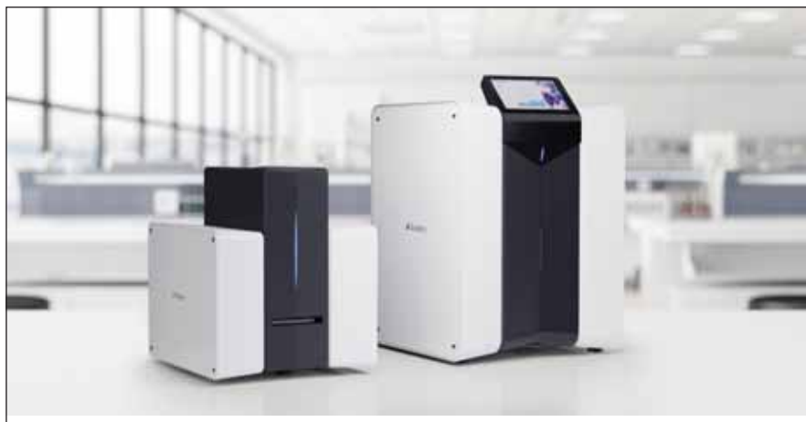
Obr. 2. Dvě kapacitní varianty zařízení Scpio, laskavostí firmy Beckman Coulter.