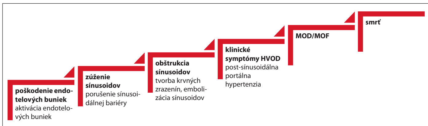
Obr. 1. Patofyziologický proces HVOD.

Zdroj: upravený podľa Cairo et al., 2020 [14].