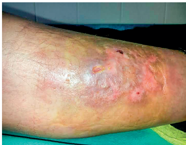
Obr 1. Necrobiosis lipoidica – nežiaduci účinok na koži predkolenia, ktorý vznikol v priebehu liečby IFN- \alpha u 52-ročnej pacientky s polycytémiou vera

IFN a začať s liečbou intravenóznymi imunoglobulínmi. Nežiaduce účinky, ktoré viedli k ukončeniu liečby, uvádza tabuľka 3. V celom súbore nežiaduce účinky viedli k ukončeniu liečby rIFN- \alpha u 13 (22 %) pacientov, s mediánom liečby 25 (3–48) mesiacov. Podávanie Peg-IFN- \alpha s mediánom 21 mesiacov, nevedlo ani v jednom prípade k ukončeniu liečby. Trombotické komplikácie malo v celom súbore 13 (22 %) chorých (tab. 4), 10 s diagnózou PV, v jednom prípade ET a dvaja s PMF. Z nich sa pred diagnózou MPN vyskytol u 2 pacientov