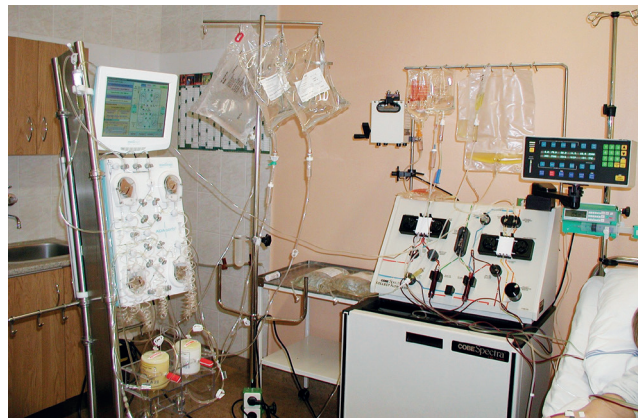
Foto 1 Přístrojové vybavení při LDL-aféřeze.

Princip reohemaferézy (RHF): U RHF je plazma, získaná stejným postupem jako u IA, prohátna “dru-