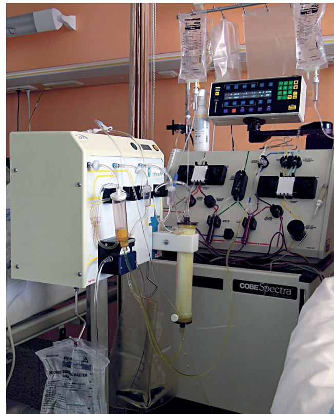
Foto 2 Přístrojové vybavení při reoferéze.

o toxicitu ACD-A (mírné klinické příznaky hypokalémie). Po infuzi s kalcem (Calcium gluconicum 10%, Braun) došlo k vymizení potíží. Infuze s kalcem u našich pacientů nepodáváme standardně při každém