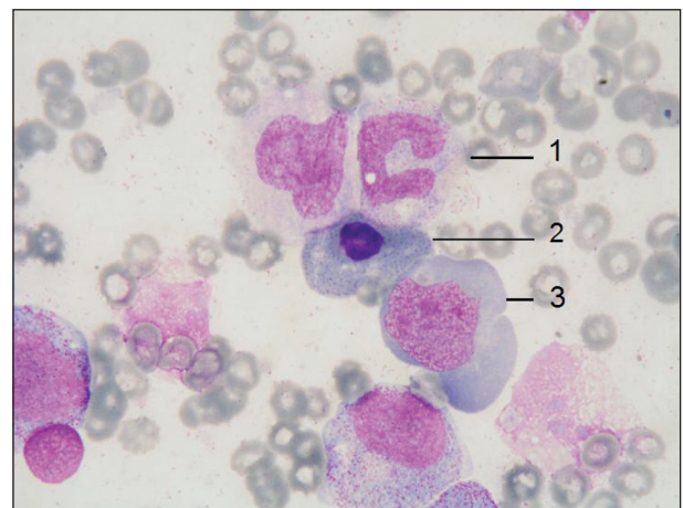
Obr. 1. Obraz megaloblastické přestavby kostní dřevě u našeho nemocného – gigantická tyč (1), megaloblast ortochromní s bazofilním tečkovaním (2), megaloblast polychromní (3), barvení May-Grünwald Giemsa, zvětšení 1000 x