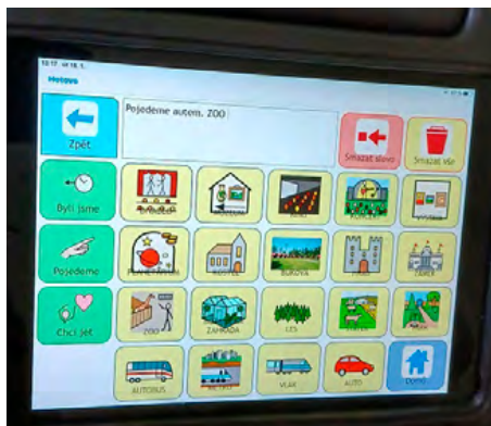
Obrázek 7: Práce na iPadu s komunikační tabulkou

Chlapec se mohl vyjádřit, co ho baví, co viděl, co dělal nebo co chce dělat.