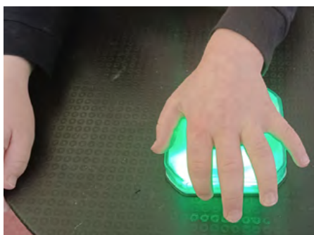
Obrázek 1: Jednovkazový komunikátor

systém je vhodný především u nemluvicích dětí s těžkou vývojovou dysfázií a anartrií. (Rozdělení pomůcek upraveno dle Šarounová, 2014.)