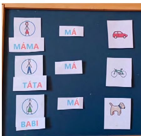
Obrázek 6: Tvoření tříslislovných vět s kartami se slovy a obrázky

Práci A. se zařízením Tobii PCEye Go však stále ovlivňuje dystonie. Zatím se nedaří psaní na notebooku s písmenkovou tabulkou (vytvořenou na míru v programu GRID 2). Vyhledávání a skládání písmen do slabik a krátkých slov je obtížné, vyžaduje soustředění, fixaci pohledu očí a udržení postury. To je pro chlapce příliš únavné, dochází k častým chybám a výsledek je demotivující. Po dohodě s učitelkou proto chlapec využívá k tréninku psaní slabik, slov a krátkých vět obyčejné tištěné karty se slovy a obrázky, které jsou rozložené na stole nebo na tabuli. To se daří lépe (obrázek č. 6).