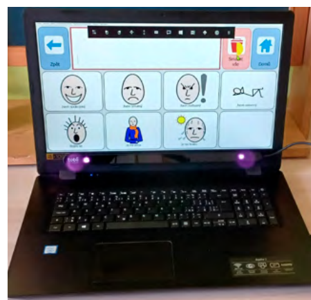
Obrázek 4: Práce A. na notebooku se zařízením Tobii PCEye Go. Při vytváření mřížky Pocity byly použity symboly Widgit

Hledali jsme i další možné způsoby ovládní komunikačních programů. Vyzkoušeli jsme s A. práci na stolním počítači s připojeným zařízením Tobii PCEye Go. Rodina získala z daru od soukromého dárcce i notebook vybavený tímto zařízením. A. začal pracovat s obrázkovými mřížkami z Gridu 2 (viz obrázek č. 4 a 5). Vzhledem k četným dystoniím bylo obtížné udržet polohu hlavy a kalibrace byla tedy zdlouhavá. Po nastavení se však poměrně dobře daří práce s obrázkovými komunikačními tabulkami. Zařízení je využíváno i ve výuce, kde A. pracuje s různými vzdělávacími aplikacemi.