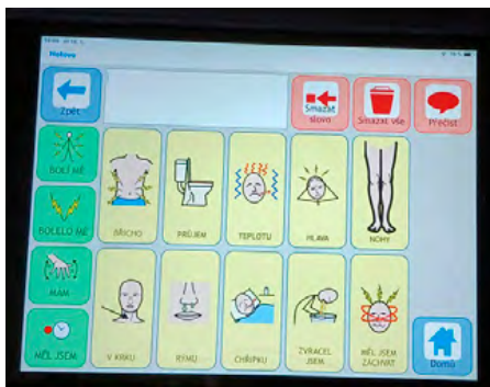
Obrázek 8: Komunikační tabulka v iPadu