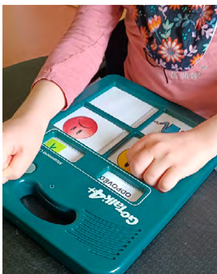
Obrázek 2: Práce s komunikátorem Go T