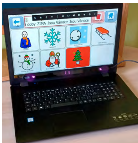
Obrázek 5: Práce A. na notebooku se zařízením Tobii PCEye Go. Chlapec A. označil pohledem oči buňku Vánoce – červeně zabarvení

Práci A. se zařízením Tobii PCEye Go však stále ovlivňuje dystonie. Zatím se nedaří psaní na notebooku s písmenkovou tabulkou (vytvořenou na míru v programu GRID 2). Vyhledávání a skládání písmen do slabik a krátkých slov je obtížné, vyžaduje soustředění, fixaci pohledu očí a udržení postury. To je pro chlapce příliš únavné, dochází k častým chybám a výsledek je demotivující. Po dohodě s učitelkou proto chlapec využívá k tréninku psaní slabik, slov a krátkých vět obyčejné tištěné karty se slovy a obrázky, které jsou rozložené na stole nebo na tabuli. To se daří lépe (obrázek č. 6).