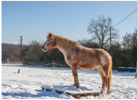
Obrázek 1: Příklad úkolu, kdy klient díky tzv. napojení a motivaci navedl koně k vystoupení předníma nohama na vyvýšenou paletu pouze svojí řečí těla bez použití vodítka.

Při plnění jednoduchých úkolů (vodění koně na vodítku přes překážky apod.) se klienti učí autenticitě, přirozené řeči těla, odezírání nonverbálních signálů, empatii a principům efektivního učení s prvky aplikované behaviorální analýzy (obr. 1). K optimální reakci koně dochází v případě, že je dostatečně motivován ke spolupráci a mezi koněm a člověkem probíhá tzv. napojení, stejně jako v některých terapeutických metodách využívaných u dětí s neurovývojovými poruchami (např. Son-Rise program, Floor-Time therapy method). Při využití napojení, motivace a správně načasované odměny dochází k upevnování a posilování žádoucího chování a procesu efektivního učení. Při komunikaci s koněm ze země ovlivňuje klient chování koně svojí posturou a neverbální komunikací.