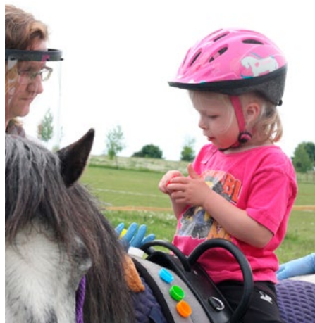
Obrázek 5: Aktivita z metodiky Prvky logopedie v HPSP k trénování barev a jemné motoriky s edukačním pásem se speciální pedagožkou.

Logopedicko-hiporehabilitační jednotka trvá obvykle hodinu, během níž se s koněm pracuje ze země i z jeho hřbetu. Součástí kontaktu s koněm bývá také čištění koně. Klientovi je poskytována logopedie na míru (obr. 5). Individuální přístup je zajištěn terapeutickým plánem. Ten je sestaven na základě zpráv či jinak získaných údajů o zdravotním stavu klienta a s ohledem na jeho aktuální řečovou úroveň, schopnosti a dovednosti. Spolupráce s logopedem, ke kterému uživatel dochází, je nutná. Podstatným zdrojem informací jsou také rodiče.