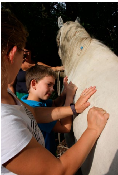
Obrázek 4: Trénink motorických sekvencí rukou, cvik pro propojení hemisfér a zlepšení koncentrace.

Logopedicko-hiporehabilitační jednotka trvá obvykle hodinu, během níž se s koněm pracuje ze země i z jeho hřbetu. Součástí kontaktu s koněm bývá také čištění koně. Klientovi je poskytována logopedie na míru (obr. 5). Individuální přístup je zajištěn terapeutickým plánem. Ten je sestaven na základě zpráv či jinak získaných údajů o zdravotním stavu klienta a s ohledem na jeho aktuální řečovou úroveň, schopnosti a dovednosti. Spolupráce s logopedem, ke kterému uživatel dochází, je nutná. Podstatným zdrojem informací jsou také rodiče.