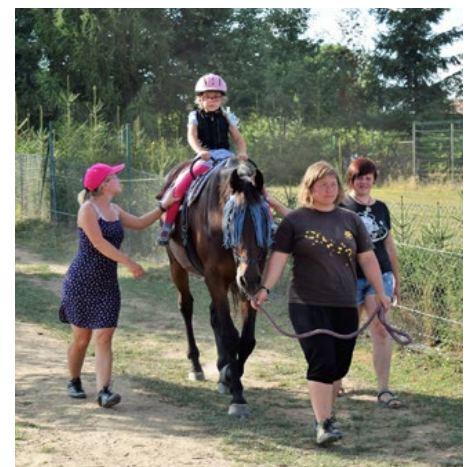
Obrázek 3: Verbální aktivity s dětským klientem při hiporehabilitaci (rozhovor, odpovědi na otázky, protiklady, verbální fluence a mnoho dalších možných).

Propojením logopedie a Hiporehabilitace v pedagogické a sociální praxi dochází ke komplexnímu působení na klienta s narušenou komunikační schopností za pomoci koní, poníků a souvisejících aktivit (obr. 3). Cíle hiporehabilitace mohou být komplexní, například využití působení koně současně na ovlivnění polykání a tvorbu hlásek na fyzické úrovni, na motivaci k jízdě na koni na úrovni psychické a na kontakt s logopedem na úrovni sociální (Macauley et al., 2021).