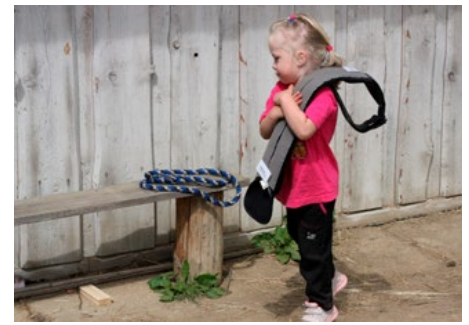
Obrázek 6: Dětská klientka odnáší edukační pás po hiporehabilitaci a učí se tak samostatnosti a zodpovědnosti.

Při hiporehabilitační jednotce je kladen důraz na vedení k samostatnosti, zodpovědnosti a udržení pozornosti. Aktivity jsou zaměřeny na oslabené stránky řeči (sluchová percepce, vyjadřování, výslovnost, gramatika, čtenářská a matematická pre/gramotnost, posloupnosti jak dějové, tak časové) a na rozvoj ostatních dovedností nutných k úspěšné interakci s okolím (zraková percepce, pozornost, koncentrace, paměť, vnímání času, prostoru a tělesného schématu). Pracuje se i s různými pomůckami speciálně vytvořenými pro tyto terapie, zejména s edukačním pásem (obr. 6). Také samotné prostředí statku je pro klienty komplexně stimulující. Prací na statku a péčí o zvířata se rozvíjí hrubá i jemná motorika. Verbální i neverbální projevy lidí jsou nenucené a také jsou usměrňovány zpětnou vazbou zvířat na jejich chování.