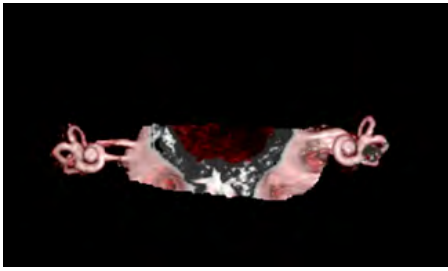
Obrázek 6: Septum vnitřního zvukovodu