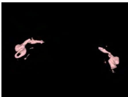
Obrázek 4: Common cavity rekonstrukce