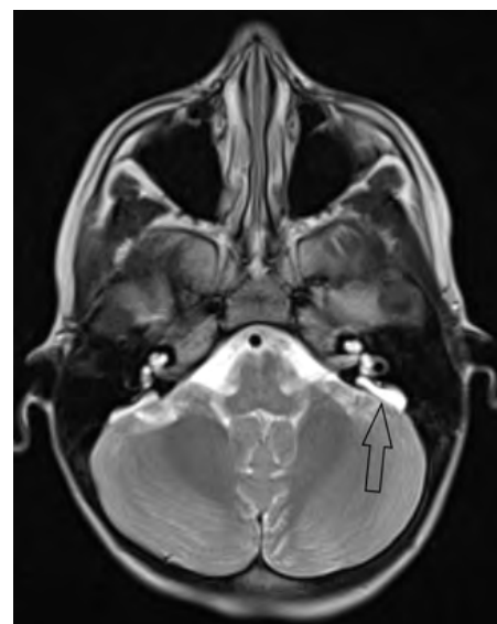
Obrázek 5: EVA syndrom

vzdušné vedení, při progredující velmi těžké nedoslýchavosti je indikována kochleární implantace. Rehabilitace je s velmi dobrými výsledky (Dewan, 2009, Sennaroglu, 2002) (obr. 5).