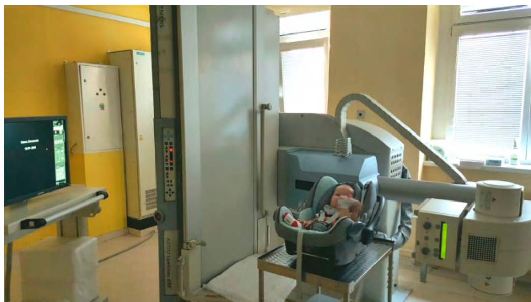
Obrázok 1.: Poloha dieťaťa pri VFSS

Poloha dieťaťa pri VFSS: Dieťa je buď v polosede, sede, alebo stojí. Dojčatá a menšie deti môžu byť v kočíku alebo v autosedačke, väčšie na vozíku alebo v kresle so zabezpečenou správnu postúrou trupu, hlavy a krku (hlava nesmie byť zaklonená) (obr.1). Rozhodne by sme nemali realizovať vyšetřenie tak, aby dieťa držal na rukách rodič.