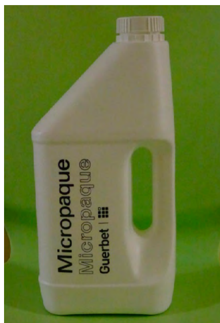
Obrázok 3: Kontrastná látka

Pomôcky na pitie a jedenie počas VFSS a použité konzistencie: kvôli transparentnosti vyšetrenia je dôležité, aby sa počas VFSS použili predmety (fľaša s cumľom, pohár, lyžička), ktorými je dieťa kŕmené doma a aby ho kŕmil človek, ktorý ho kŕmi každý deň. Ako kontrastná látka sa používa nejódová báriová kontrastná látka (obr. 3), ktorá je v prípade aspirácie dieťaťa šetrnejšia voči jeho pľúcam. Ak má dieťa problém so saním z fľaše s cumľom, použijeme striekačku alebo lyžičku. U väčších detí môžeme použiť pohár, alebo aj slamku. Obyčajne sa pri vyšetrení podávajú tri konzistencie: tekutá (mlieko, čaj), kašovitá (jogurt, jablčná výživa a iné výživy) a tuhá (koláč, keks, chlieb).