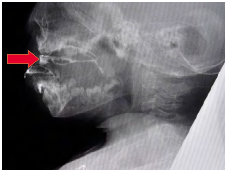
Obrázok 2: Laterálna projekcia, orálna prípravná fáza s poruchou orálnej kontroly, šípka označuje miesto polohy sústa

ciest, činnosť faryngeálnych konstriktorov) a začiatok ezofageálnej fázy. Pre vylúčenie asymetrie štruktúr zvolíme tzv. A/P (pre-dožadnú) projekciu (Frey, 2011, Biber, 2012, Neumann, Nightingale, 2012).