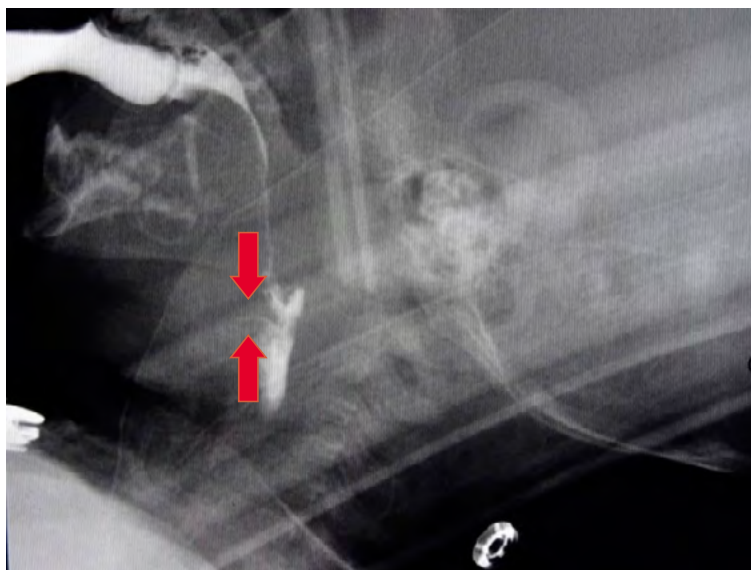
Obrázok 4: Penetrácia, kontrastná látka konturuje hornú plochu hlasiviek, nepreniká pod ne