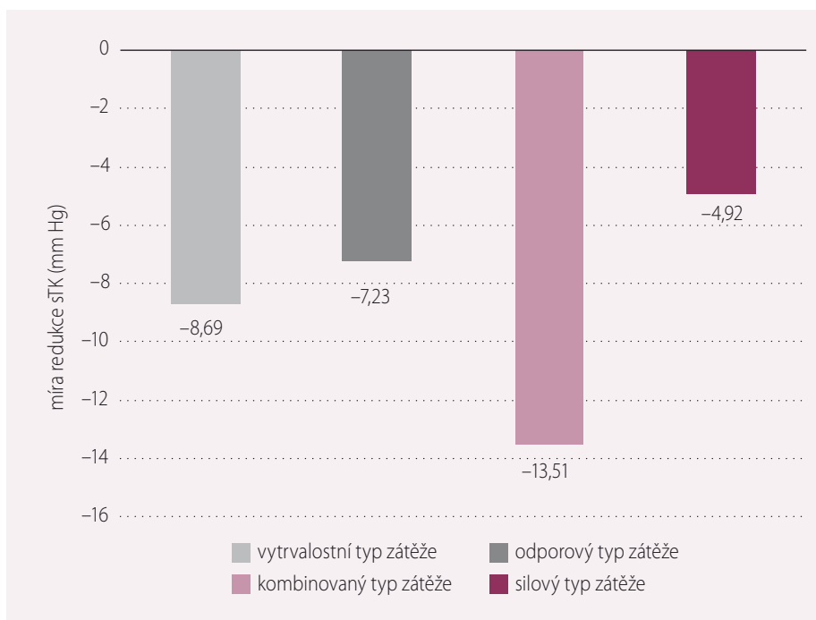
Graf 2. Vliv jednotlivých typů zátěže na pokles hodnot TK (mm Hg). sTK – systolický krevní tlak