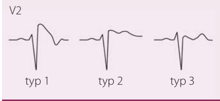
Obr. 1. EKG projevy Brugada syndromu, jediný „diagnostický“ je typ 1, tj. ST elevace ≥ 2 mm následovaná negativní vlnou bez izoelektrické nebo s minimální izoelektrickou linií, zvaný také „Coved type“; další dva typy nazýváme „Saddle back“ – typ 2 má mít výše J bod než T vlnu, typ 3 naopak. Upraveno dle [21,22].

nost NSS je u těchto jedinců o něco menší než u jedinců s korigovaným prodlouženým QT intervalem (4 vs. 15 %) [17]. Diagnostická kritéria pro LQTS jsou založena na rodinné anamnéze a EKG nálezu (tab. 4) [18]. Základními specifickými opatřeními jsou: u LQTS1 zákaz namáhavější/kompetitivní sportovní aktivity (obzvláště plavání a vodní sporty), vyvarovat se náhlým hlasitým zvukům (zvonění budíku) u LQTS2 a všem lékům prodlužujícím QT interval, což platí univerzálně pro všechny LQTS. Z léků jsou velmi efektivní betablokátoři v případě LQTS1, méně již u LQTS2 a LQTS3 [19]. U vysoce rizikových pacientů je s výhodou levostranná denervace srdečního sympatiku (left cardiac sympathetic denervation – LCSD); největší studie (n = 147 pacientů) u extrémně rizikových pacientů (QTc 543±65 ms) prokázala 91% redukci srdečních příhod [20]. Doporučené postupy HRS/EHRA/APHSR z roku 2013 nedoporučují implantaci ICD u asymptomatických pacientů s LQTS, u kterých nebyl vyzkoušen betablokátor krom zvláštních případů: