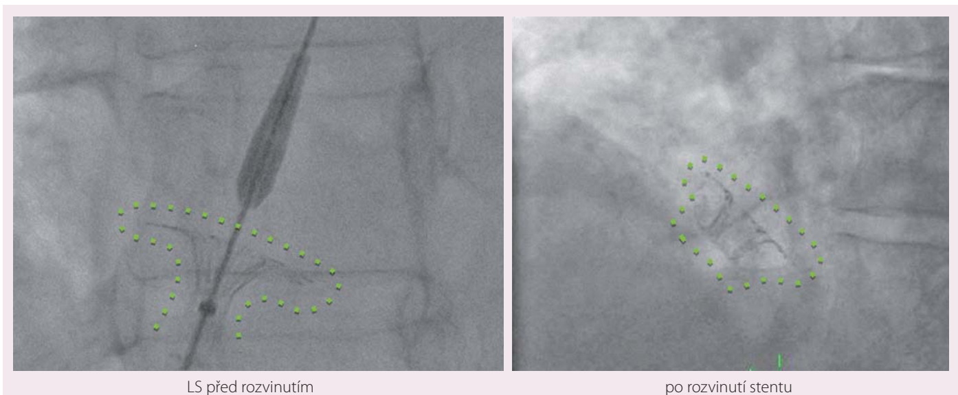
Obr. 2. IASD® v RTG obraze.

Dalším kritériem pro zařazení byl průkaz poruchy diastolické funkce levé komory pomocí echokardiografie pomocí pulzní dopplerovské a tkáňové echokardiografie a průkaz zvětšení levé síně. Pacienti s anamnézou cévní mozkové příhody, hluboké žilní trombózy, plicní