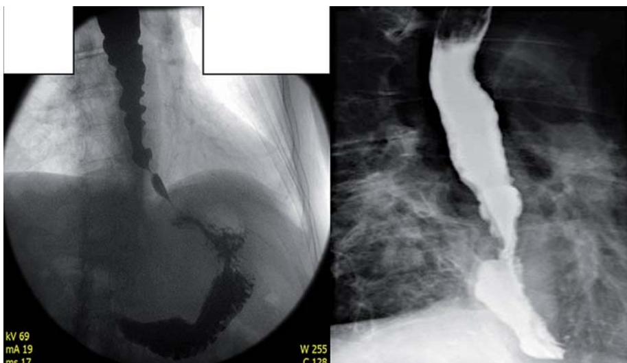
Obr. 3. RTG obrázek pacienta s achalázií III typu se spazmy před POEM (vlevo) a po POEM (vpravo). Rok po POEM je pacient zcela asymptomatický.

stoupil úspěšný re-POEM na zadní stěně jícnu. U jiného pacienta s diagnózou Jackhammer esophagus byla přítomna kompletní symptomatická odpověď, po třech měsících došlo k deformaci a dilataci jícnu s objevením se dysfagických příznaků, po částečně úspěšné balonové dilataci zvažujeme re-POEM na zadní stěně jícnu. Procento zlepšení se pohybuje okolo 90 % a přetrvává i dvanáct měsíců po POEM. Symptomatická odpověď je doprovázena i zlepšením manometrických parametrů.