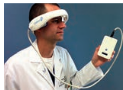
Obr. 6. CLOTBUST-ER (Cerevast Therapeutics).

ných sonografistů. Jednou z možností, jak sonotrombolýzu uvést do běžné praxe, je vytvoření automatických přístrojů, které nevyžadují přítomnost zkušeného operátora. Pilotní studií s přístrojem CLOTBUST-ER firmy Cerevast (obr. 6) byla studie CLOTBUST-HF . Do studie bylo zařazeno 20 pacientů s proximální intrakraniální okluzí (70 % ACM, medián NIHSS 15). Všichni pacienti tolerovali dvouhodinovou insonaci přístrojem a u žádného nedošlo k rozvoji IC krvácení. Po 2 hod bylo plné rekanalizace dosaženo u osmi pacientů (40 %) a u dvou pacientů (10 %) došlo k rekanalizaci parciální. Tyto výsledky jsou velmi povzbudivé, je dosaženo minimálně dvojnásobné rekanalizace oproti sa-