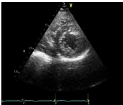
Obr. 1. Echokardiografický obraz nekompaktní kardiomyopatie – parasternální krátká osa na konci systoly, poměr nekompaktní ke kompaktní vrstvě je > 2.