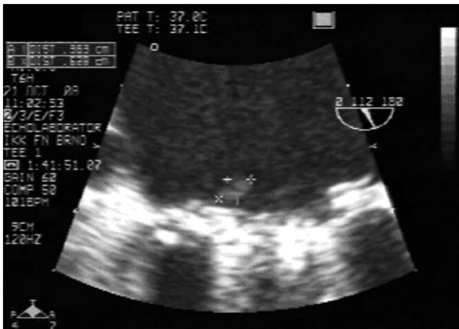
Obr. 1. Hyperechogenní útvar velikosti 4 × 7 mm v oblasti mitrálního anulu.