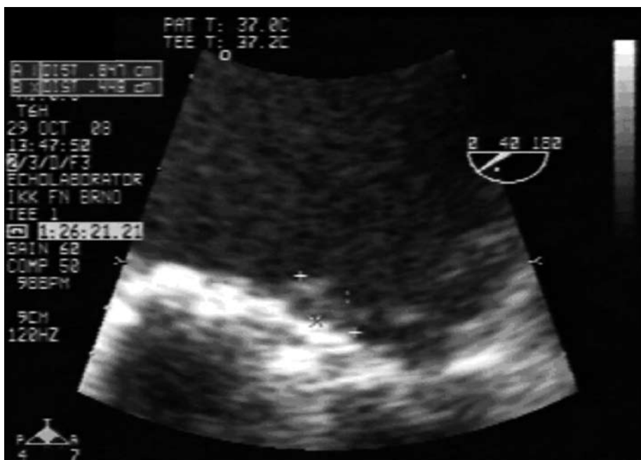
Obr. 2. Viditelná progresse s nálezem 2 hyperechogenních útvarů vel. 4 × 8 mm a 4 × 4 mm.

se podařilo zvládnout přelčením antibiotiky dle citlivosti. Pacient byl propuštěn domů dne 12. 11. 2008 afebrilní, tlakově a kardiopulmonálně kompenzovaný. Pacient byl s odstupem měsíce při ambulantní kontrole v klinicky dobrém stavu, subjektivně bez obtíží, účinně antikoagulovaný, bez krvácivých projevů a kontrolní TEE bez nálezů patologických nitrosrdečních útvarů. V průběhu ambulantního sledování, které probíhá doposud, je pacient kardiopulmonálně kompenzovaný bez projevů nových tromboembolických příhod.