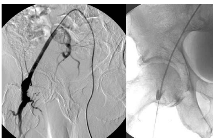
Obr. 2. Zavedení katetr do femoropopliteálního bypassu k lokální trombolýze.