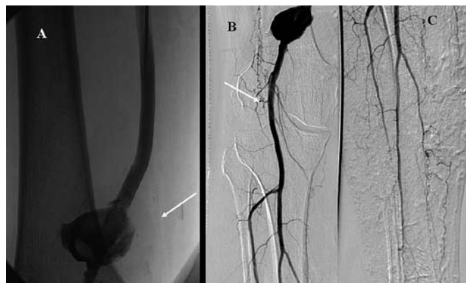
Obr. 3. Kontrolní angiografie po 24 hod trombolýzy prokazuje průchodný bypass (panel A) a velké pseudoaneuryzma v místě minulé implantaci stentu (panel B) a dobře průchodné bérčové tepny (panel C).