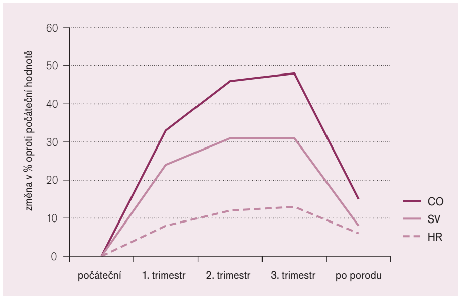
Graf 1. Změny systémové hemodynamiky v těhotenství.