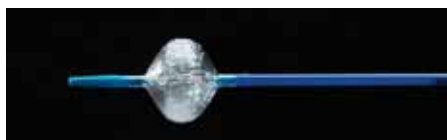
Obr. 1. Arctic Circler® Balloon.

Kardiologické oddělení Nemocnice Na Homolce, Praha lucie.sediva@homolka.cz