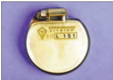
Obr. 5. Jeden z prvních kardiostimulátorů vybavený lithiium-jodidovou baterií. Tento model (V12-L151 firmy LEM) pochází z Itálie z roku 1975.

Lithiová baterie se na rozdíl od zinko-rtuťové baterie těší řadě výhod. Vysoká energetická denzita umožnila výrobcům zmenšit rozměry generátoru (obr. 5). Napětí pulzu klesá kontinuálně s vybíjením oproti náhlému poklesu u zinko-rtuťového článku a dává možnost lékaři včas odhadnout nutnost elektivní výměny. Životnost byla odhadována podle modelu na 5 až 10 i více let. Při vybíjení nevzniká žádný plynný meziprodukt a generátor může být hermeticky uzavřen.