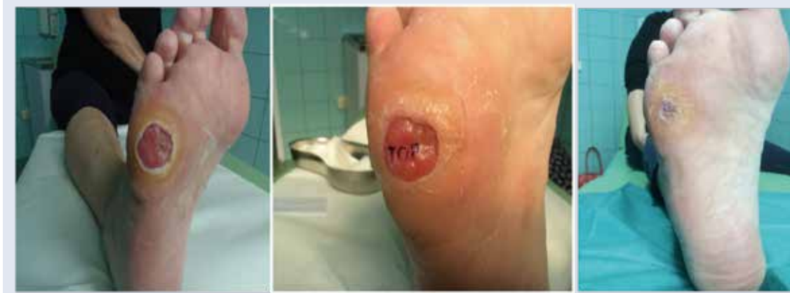
Obr. 3 | Instilácia Heberprotu-P do spodiny a okrajov dlhodobo sa nehojacej neuropatickej ulcerácie